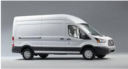
Masinele din imagine sunt cu titlu de prezentare